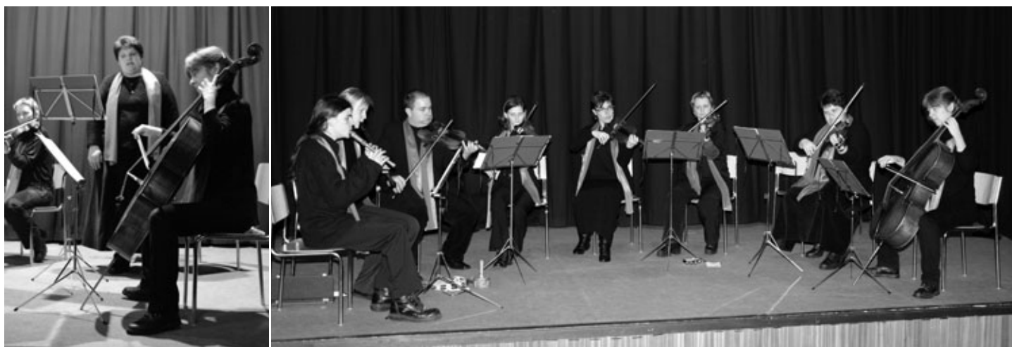
Adventní koncert 19. 12. 2010