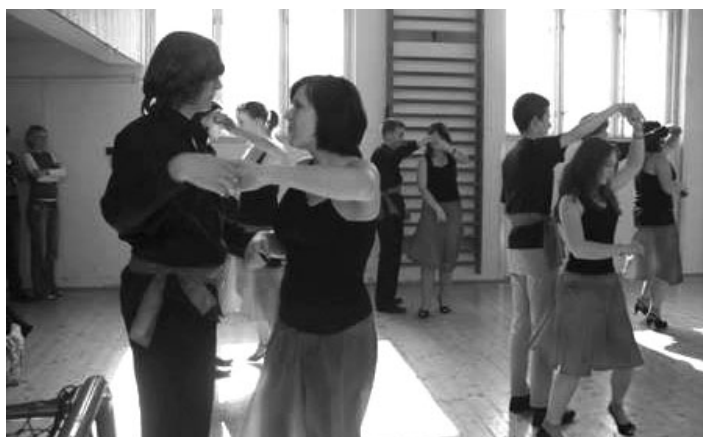
Nácvik předtancení na školní ples 2011