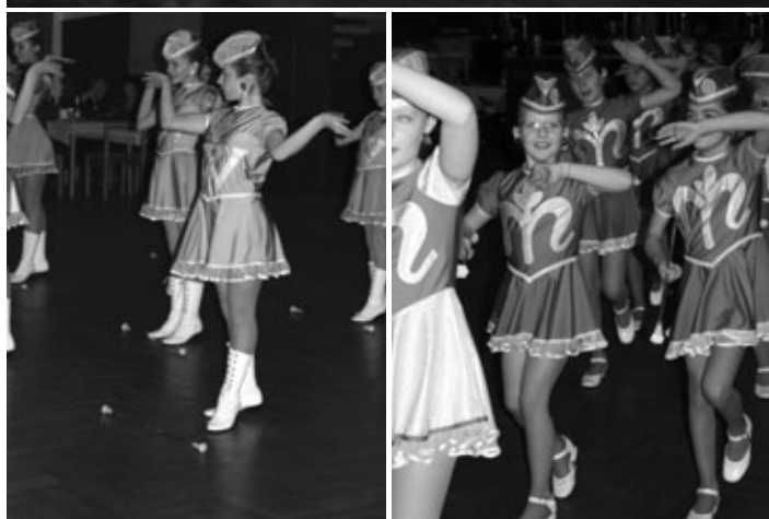
5. městský reprezentační ples 25. 12. 2010