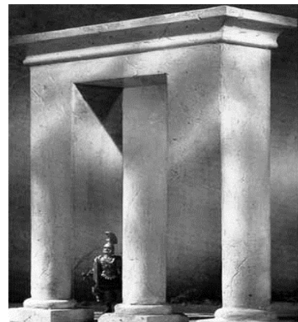
Malý optický klam Mezi kolika sloupy stojí ten Říman...?

S vědeckým pozdravem Harvey Rowe, kurátor prehistorických sbírek