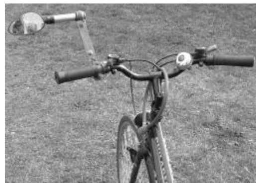
Způsob upevnění zpětného zrcátka vylepšený autorem básně

informovat o silničním provozu za sebou. Při odbočování jsou pak povinni upozornit řidiče jedoucí za nimi, o svém úmyslu změnit směr jízdy upažením ruky. V té chvíli ovládají své kolo jen jednou rukou.